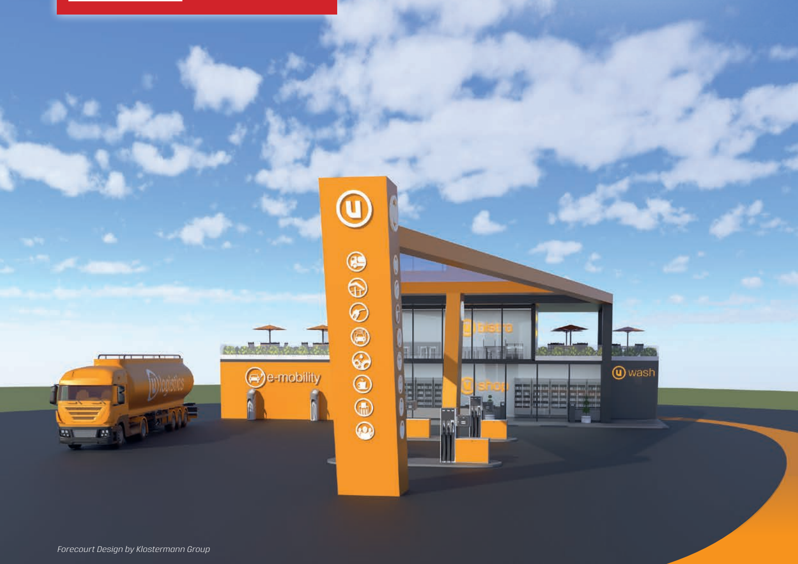
Forecourt Design by Klostermann Group